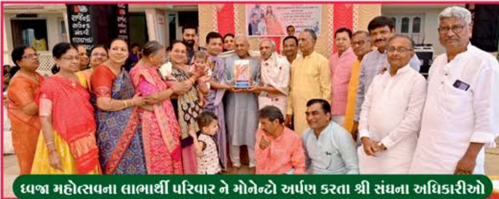
ધ્વજ મહોત્સવના લાભાર્થી પરિવાર ને મોનેન્દો અર્પણ કરતા શ્રી સંઘના અધિકારીઓ

મહોત્સવના લાભાર્થી પરિવારની અનુમોદના સહ આભાર.