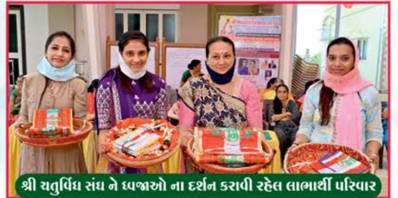
શ્રી ચતુર્વિધ સંઘ ને ધ્વજાઓ ના દર્શન કરાવી રહેલ લાભાર્થી પરિવાર